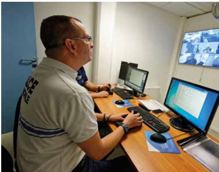
Salle de visionnage au poste de Police Municipale